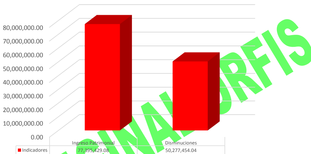
GRÁFICA 1 INGRESOS